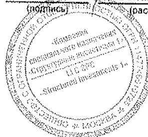
Белая Оксана Юрьевна (расшифровка подписи)